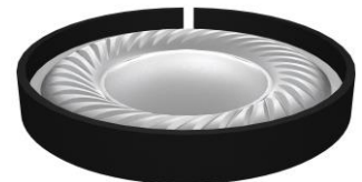
大口径 40 mm ドライバー

強磁力希土類マグネットを採用した大口径 40 mm ドライバーによる豊かな低域再生に加え、軽量 CCAW ボイスコイルを採用することで、低域から中高域までの広帯域でハイレゾ対応のクリアな高音質再生を実現**1) しました。