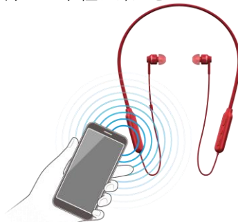
【NFC 機能搭載の Bluetooth®対応機器と簡単接続】

NFC 機能を搭載した Bluetooth®対応のスマートフォンや携帯電話、DAP などを本機にかざすだけで簡単に接続ができるので、保存した楽曲などをワイヤレス再生で手軽に楽しむことができます。