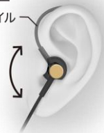
オーバーイヤーフिटスタイル